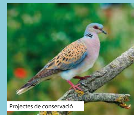
Projectes de conservació