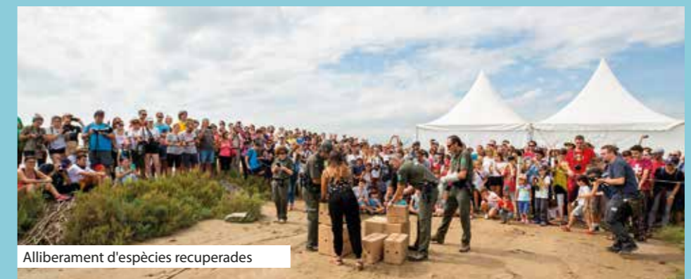
Alliberament d'espècies recuperades