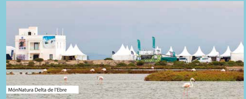
MònNatura Delta de l'Ebre